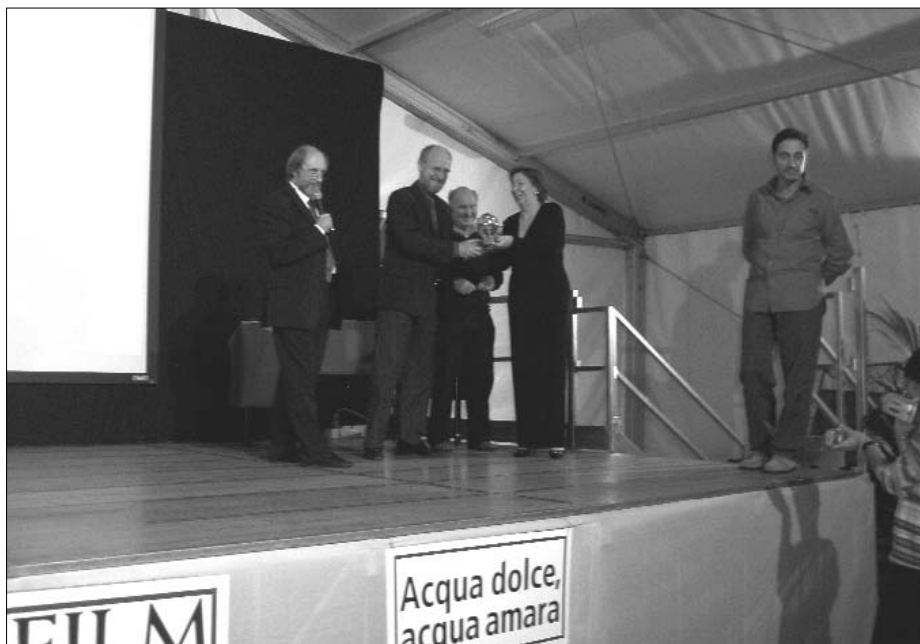
Un momento della premiazione dell'Ecofilm Festival