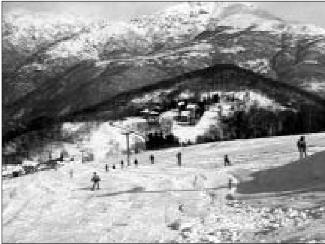
Pista di discesa ad Alpette

Con le precipitazioni nevose di gennaio sono in funzione tutti gli impianti delle Valli Orco e Soana. A Ceresole sono aperte la pista di fondo che si snoda lungo il lago artificiale con partenza da Lilla, e quella di discesa in località Chiappili Inferiore. La pista dei Chiappili è dotata di trampolini per lo snowboard e pista da bob, inoltre si possono anche affittare le attrezzature. A Lilla oltre alla pista di pattinaggio si possono anche affittare i gommoni da neve e cimentarsi in discese spericolate. Anche i prezzi dei giornalieri sono contenuti: per il fondo sono 5 euro il festivo e 3 euro il feriale, mentre per la discesa lo ski-pass giornaliero è di 10 euro e di 8 il pomeridiano. Il "regno degli sciatori" in Val Soana è a Piamprato, con una pista da discesa di circa un km attrezzato anche con un tapis roulant e una pista da fondo con un anello di 5km. inoltre, ma per i soli tesserati nei giorni pre-festivi si scia anche in notturna.