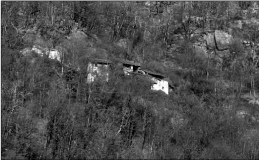
Quel che resta della borgata Parîi