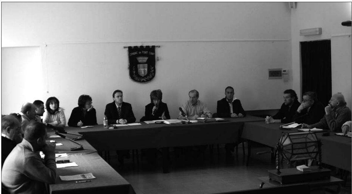
Un momento della seduta consiliare per l'acquisizione della torre Tellaria