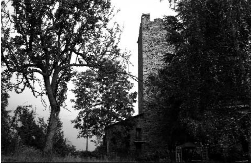
La torre Tellaria

La torre Tellaria è dei pontesi Finanziamenti a fondo perduto per via Caviglione Gallo Lassere sostituisce l'Assessore Luca Panier Interventi sull'edilizia scolastica ij Canteir festeggiano il loro patrono: San Giocondo Fabrizio Obert, il nuovo Péilacan In rete il nuovo cartone animato dedicato ai parchi Una nuova bottega in Via Caviglione Sciare in Valle Orco e Soana I ghiacciai della Valle Orco Contributi provinciali per piccoli comuni Ronco rivuole i vecchi confini del parco Un successo per il presepio vivente di Frassinetto Serata del C.A.I. ricordando "Barba Tech" GranParadisolibri Rubriche