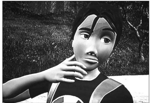
Il guardiaparco gentile...

Durante la cerimonia di premiazione del Premio letterario svoltasi il primo dicembre era stato presentato il trailer del cartone animato della fiaba vincitrice, "Il guardiaparco gentile e il ranocchio magico", da dicembre è stato inserito su Internet il cartone animato completo e chi lo desidera può vederlo visitando il sito: www.unafiabaperlamontagna.it . L'animazione è stata realizzata dal bravissimo Mario Bondici, vincitore delle due edizioni di "Un cartoon per la montagna. Buona visione.