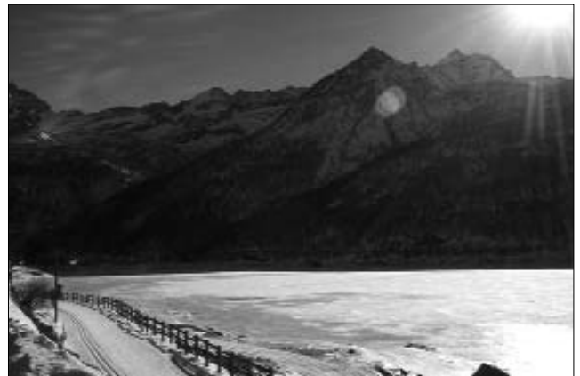
Pista di fondo a Ceresole