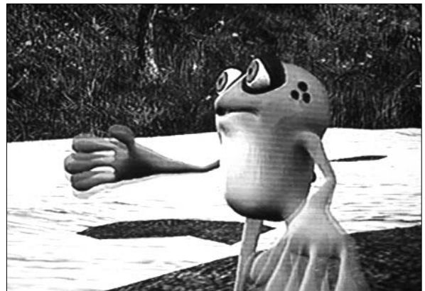
e... il ranocchio magico