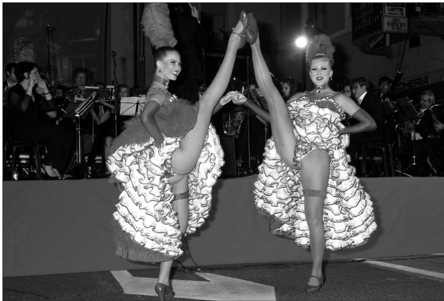
Le mitiche ballerine del Moulin Rouge ballano il Can Can nella Rua