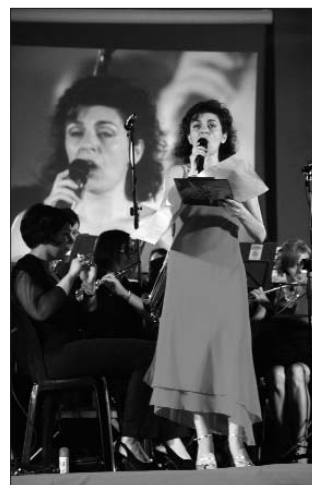
La cantante Elena Colombatto