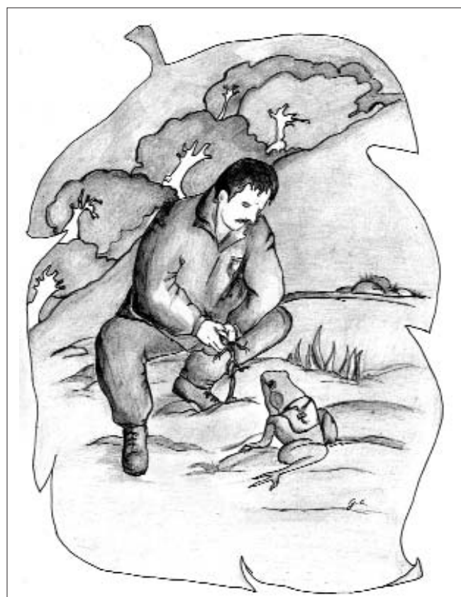
Disegno di Graziella Cortese