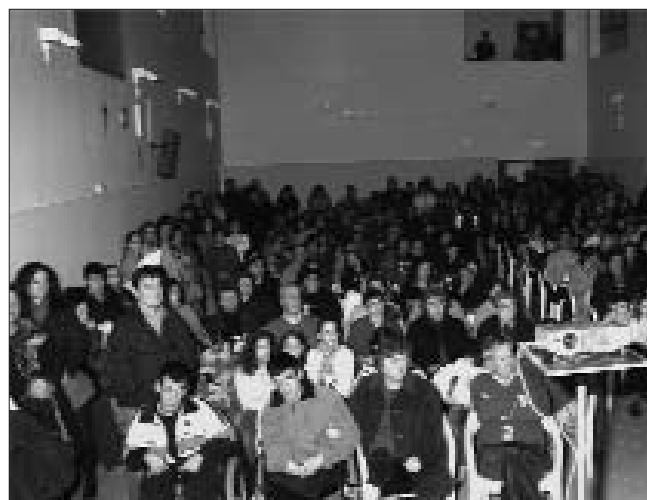
Il numeroso pubblico, di adulti e bambini, presente alla manifestazione del premio letterario