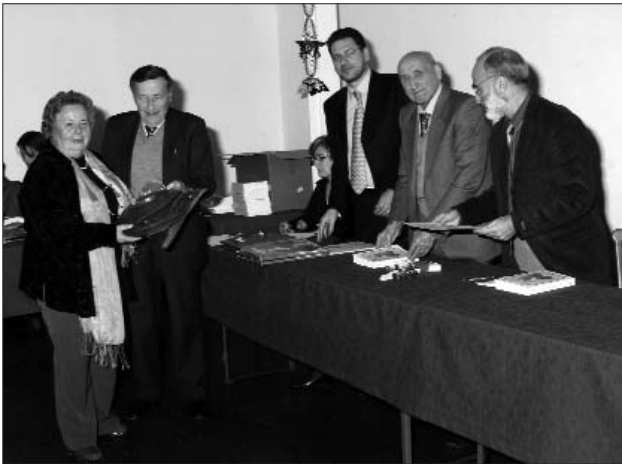
La consegna del premio Città di Torino alla vincitrice della sezione Piemontese.