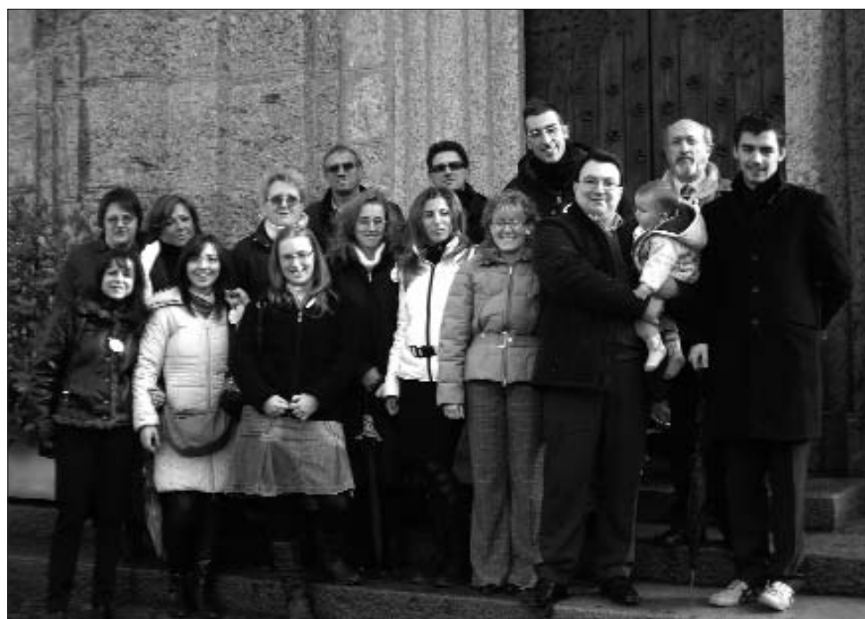
Il coro parrocchiale, alla fine della messa, in partenza per il pranzo di Santa Cecilia