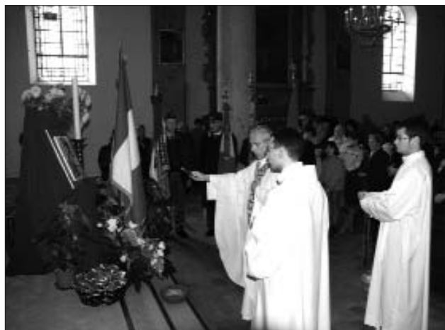
Il momento della benedizione dell’opera in ceramica, realizzata dall’Istituto Statale d’Arte “Felice Faccio” di Castellamonte, raffigurante la Virgo Fidelis.

Organizzata a cura della sezione di Pont dell’A.N.C.