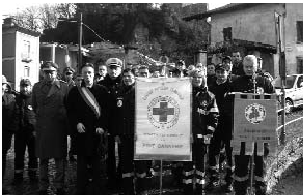
L'associazione Antincendio boschivi ai piedi della chiesa di San Costanzo, pronta per i festeggiamenti