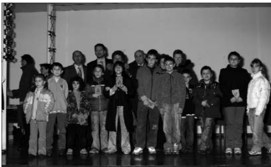
La classe di S. Antonio di Castellamonte, vincitrice del premio 'l Péilacan