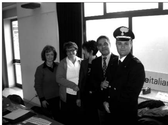
L'Ufficio postale temporaneo dedicato all'annullo filatelico delle poste italiane.