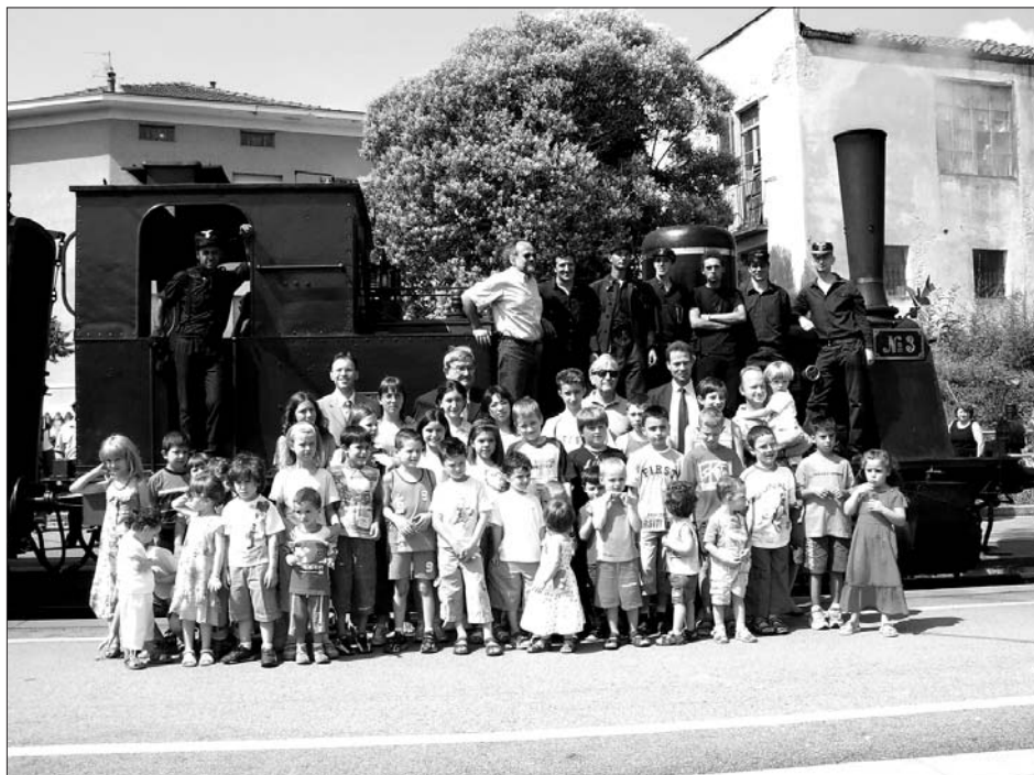
Il treno a vapore con i ragazzi dei centri estivi di Pont e di Cuornè

Balagna all'assemblea Nazionale dei piccoli comuni