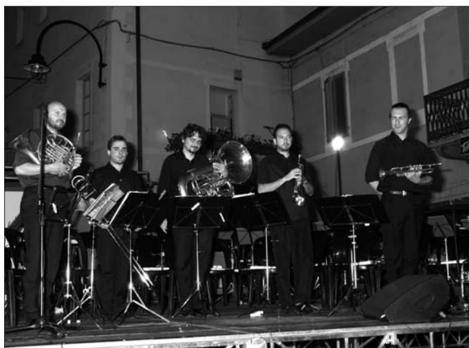
I Color Brass