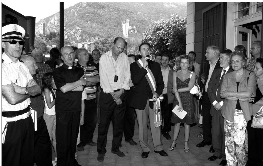
Il Sindaco e le autorità con i vertici del GTT e il Principe Serge di Jugoslavia nella stazione di Pont Canavese

Canavesana era stato anche “Treno Reale” (Nel 2007 ricorrerà il 1° centenario di questo viaggio). All’arrivo a Pont Canavese il Sindaco, la Filarmonica Aldo Cortese ed un enorme folla di grandi e piccini. Dopo i discorsi ufficiali un piccolo buffet e tante tantissime fotografie. Durante la giornata, alla stazione di Pont è rimasto aperto un ufficio postale che ha apposto l’annullo del centenario sulle cartoline realizzate per l’occasione. Diversamente dagli altri viaggi questa volta la locomotiva si è fermata a Pont e così domeni-