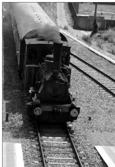
L’arrivo del treno a vapore a Pont Canavese