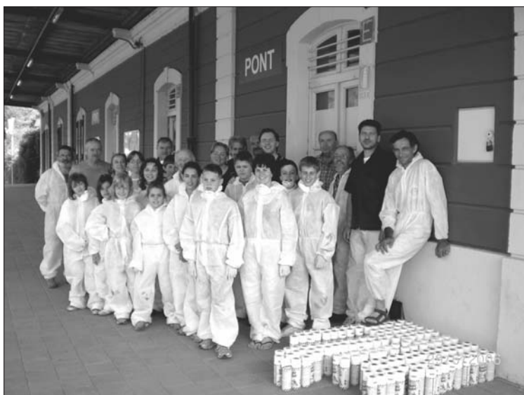
La squadra dei volontari che hanno aderito all'iniziativa.