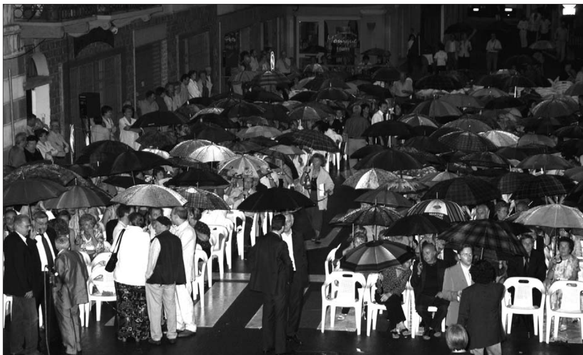
Il pubblico riparato sotto un "tetto" d'ombrelli aspetta l'inizio del concerto

Brass, un quintetto di ottoni che ha intrattenuto il pubblico non solo con l'ottima musica ma anche con piacevoli gag. Dopo l'intervallo che ha visto come tutti gli anni la consegna delle rose alle signore intervenute il concerto è ripreso con un intervento di Francesco Colucci che ha interpretato con passione "La locomotiva, una famosissima canzone del cantautore Francesco Guccini. Durante la serata è stato aperto un ufficio postale temporaneo che ha apposto, sulla nuova ed affa-