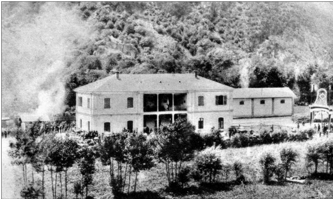
1° luglio 1906, l'arrivo del treno a vapore a Pont Canavese