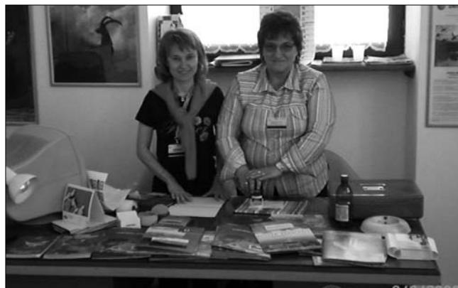
L'Ufficio postale per l'annullo della mostra dell'artigianato