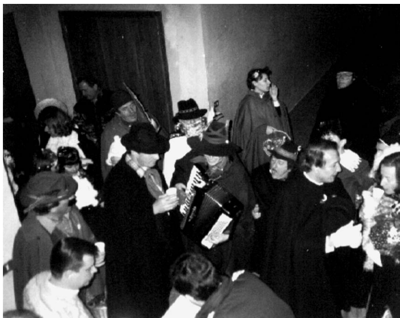
Uno scorcio dei festeggiamenti che hanno accompagnato la rappresentazione