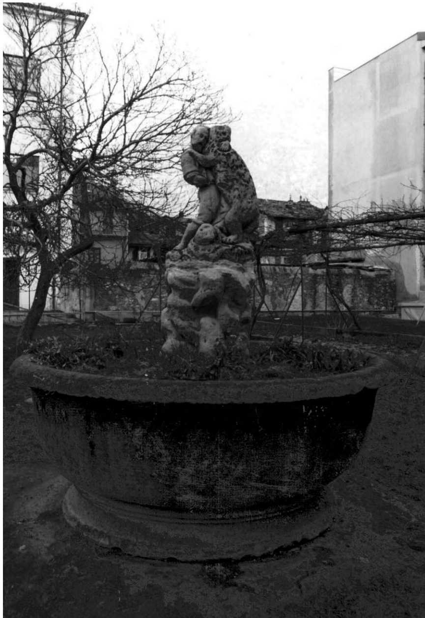
Statua del Péilacän presso l'Asilo