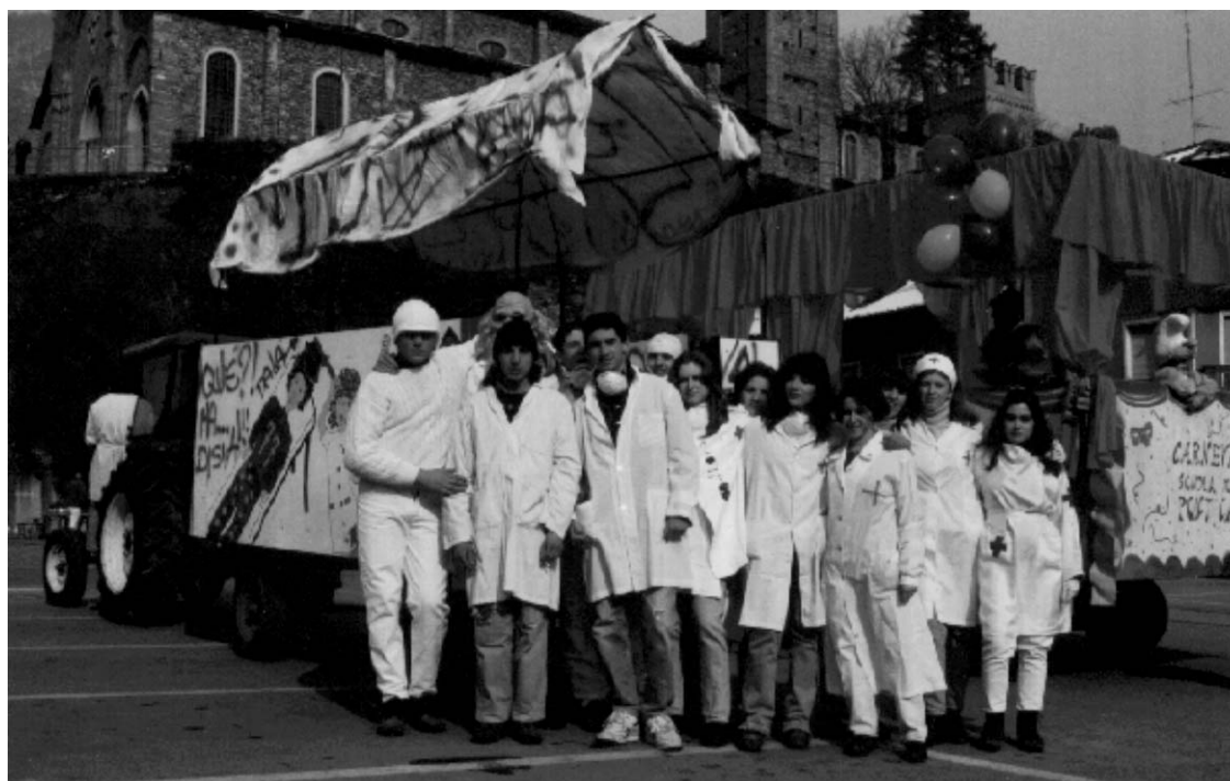
L'immaneabile carro dei COSCRITTI '78