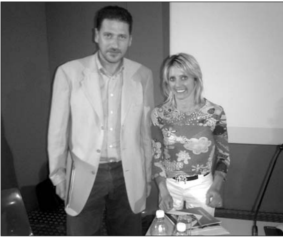
Stefania Belmondo ad Experimenta nel momento in cui aderisce all'iniziativa del Premio Letterario.

Da molti anni la vocazione di Torino alla scienza e alla tecnologia trova una sua espressione in Experimenta, manifestazione che ha consentito nel corso del tempo di diffondere l'informazione e la cultura scientifica al vasto pubblico. Rivolta soprattutto ai giovani ed ispirata ogni anno ad un tema diverso, si è incentrata quest'anno sull'interrogativo "Accetti la sfida? - Muscoli intelligenti tra sport e montagna". Nell'ambito della manifestazione si terranno sette conferenze su temi attinenti a scienza e sport, con l'attenzione particolarmente rivolta al rapporto dell'uomo con l'ambiente montano, agli sport che si praticano sulla neve e sulle rocce, alla climatologia, alle osservazioni sulla natura e a quanto i monti possono ispirare in campo cinematografico e documentaristico. Il tutto inserito nelle manifestazioni preparatorie agli eventi olimpici di Torino 2006. Madrina dell'edizione Experimenta 2005 è Stefania Belmondo, campionessa olimpionica di sci di fondo. Alla prima conferenza tenutasi il 15