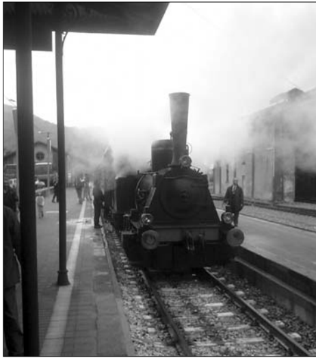
L'arrivo della locomotiva T3 nella stazione di Pont