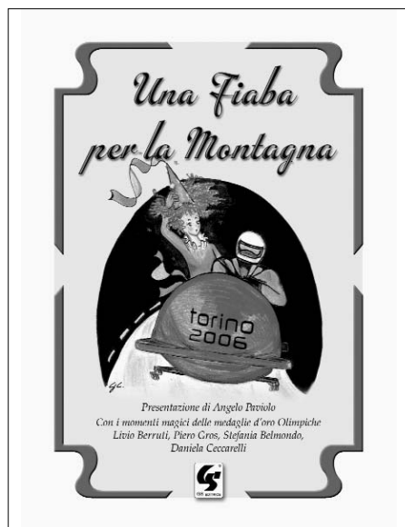
La copertina del nuovo volume di fiabe disegnata da Graziella Cortese.

Quattro medaglie d'oro olimpiche e i loro "Momenti magici"