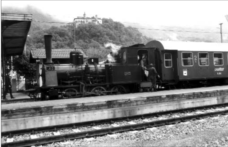
La locomotiva a vapore T3 all'arrivo nella stazione di Pont Canavese