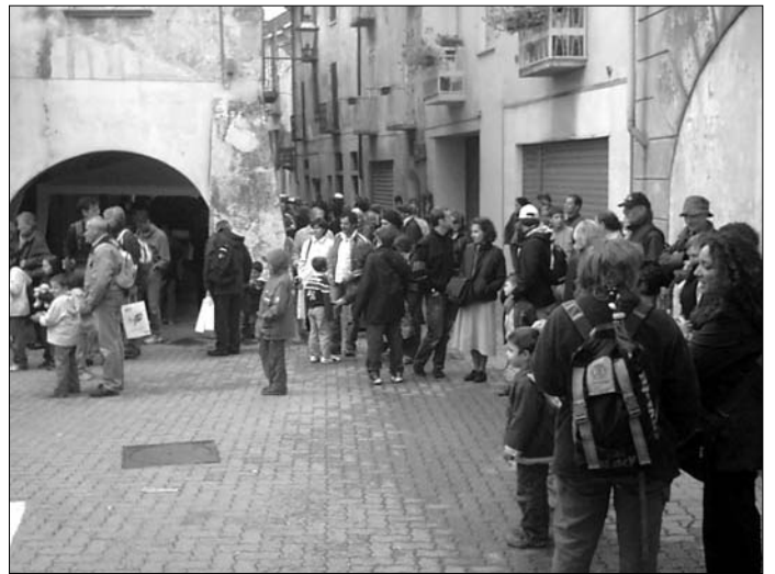
I portici di via Caviglione accolgono i turisti del treno