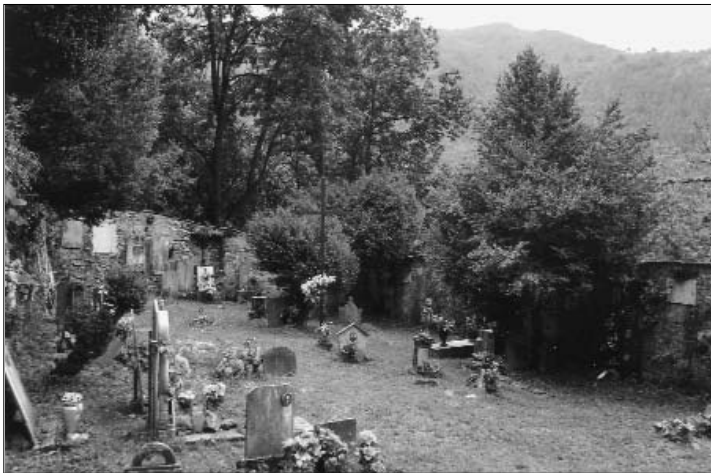
Il piccolo cimitero di Codebiòl.